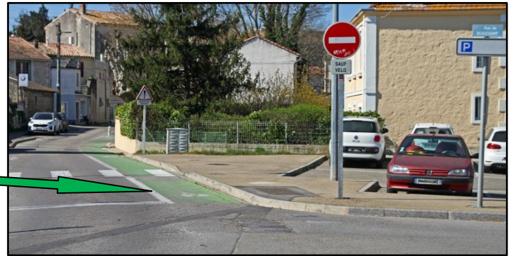
Piste cyclable occupée par des voitures en stationnement sur la place-parking du Cabaret Neuf

Pont de Crau illustre parfaitement le problème, comme un intervenant l'a signalé au cours de notre dernière Assemblée générale. Avec des habitants souvent adeptes du vélo, avec un terrain de camping et des gîtes ruraux qui accueillent de nombreux résidents cyclistes, nous n'avons qu'une piste cyclable de quelques dizaines de mètres, sur la route de Coste Basse, entre la rue de Beauchamp et la "place", ou plutôt le parking du Cabaret Neuf.