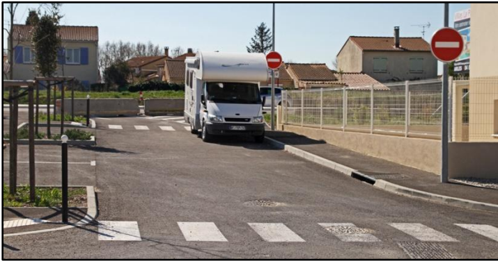
Sortie interdite sur la Route d'Eyguières