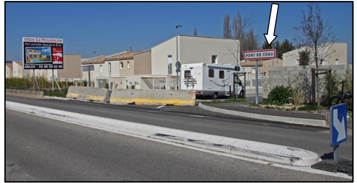
Entrée interdite en venant de la Route d'Eyguières

La question a été soulevée lors de l'Assemblée générale: pourquoi l'entrée et la sortie du lotissement "Porte des Alpilles" se font-elles uniquement par le chemin de Margaillan ?